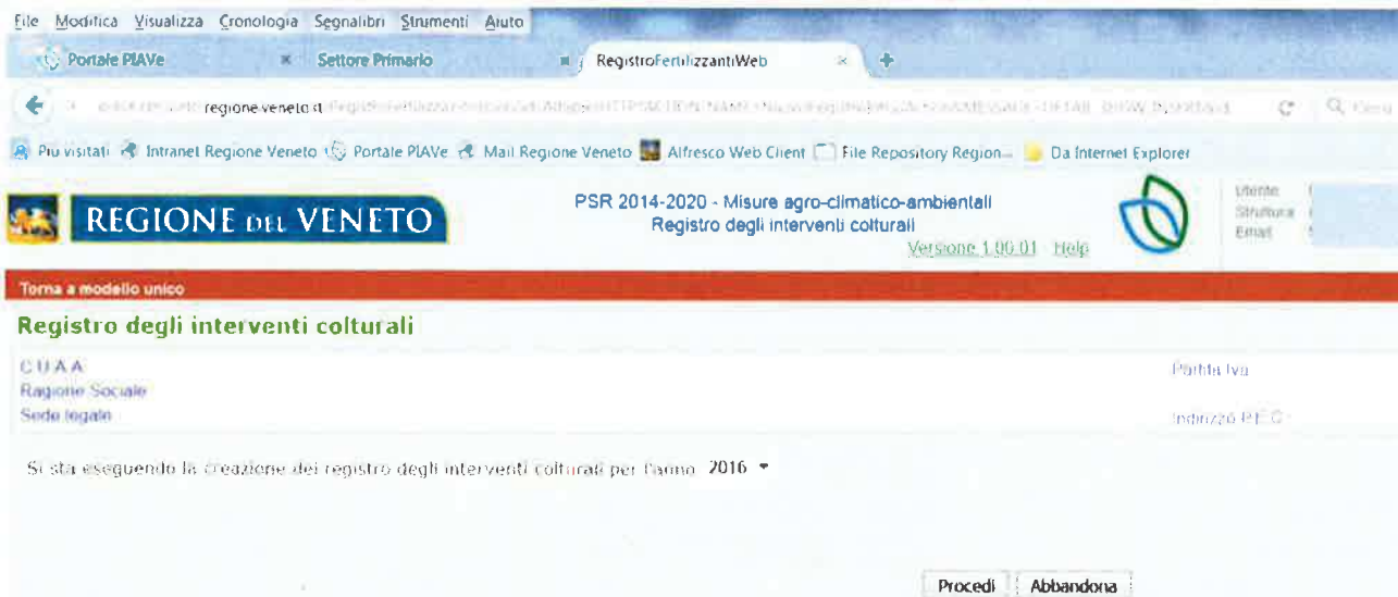
Figura 3: Apertura di un nuovo registro

A questo punto, è possibile aprire un nuovo Registro Interventi Culturali e scegliere l'anno di riferimento (Figura 3).