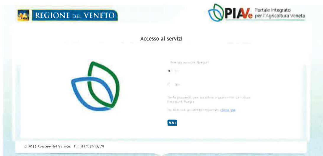
Figura 1: Scelta del Sistema di autenticazione