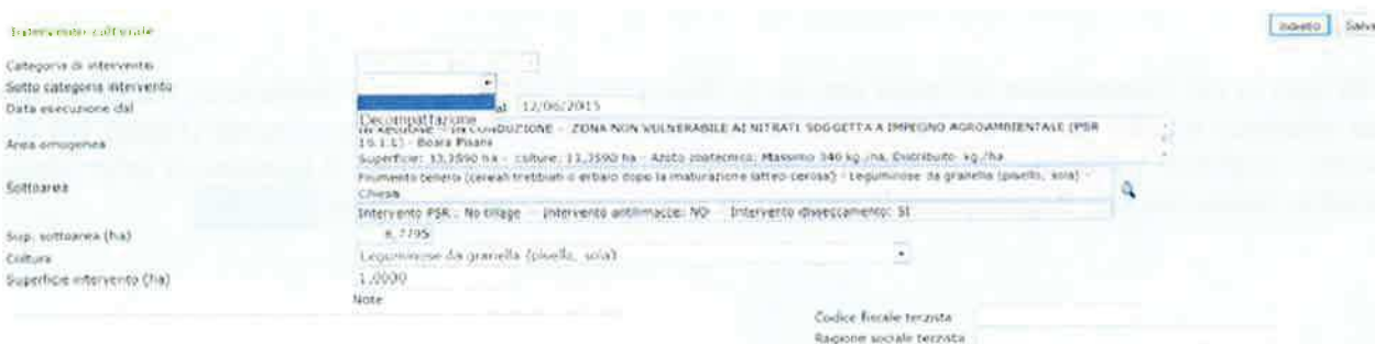
Figura 15: Inserimento dell'operazione di decompattazione (NT)

La registrazione delle lavorazioni avviene inputando le informazioni dell'unica lavorazione possibile, che è quella di decompattazione del terreno ; questa deve essere preventivamente autorizzata da parte di AVEPA. Una volta autorizzata ed eseguita, è necessario selezionarla nel RIC da "Sotto categoria intervento" (Figura 15).