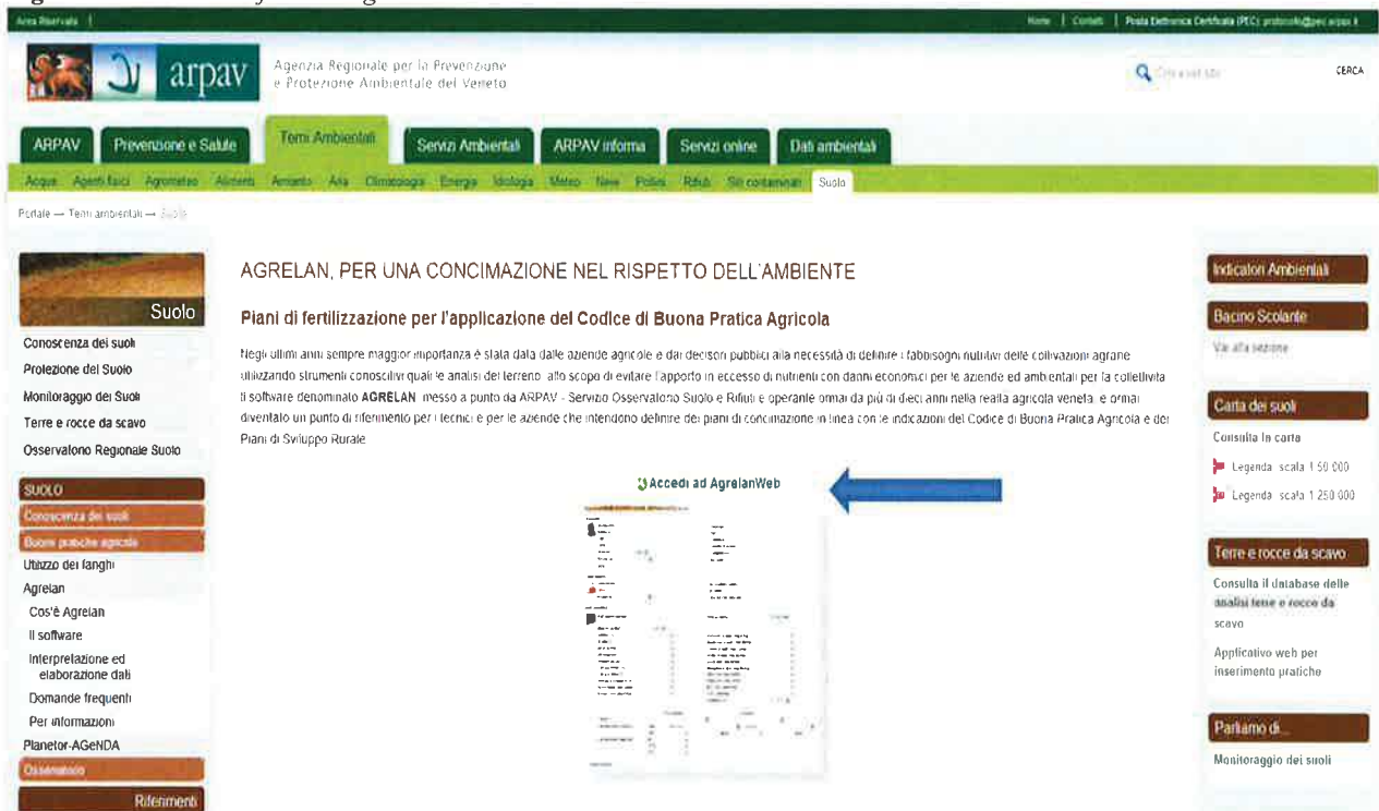
Figura 6: Accesso al software "AgrelanWeb"